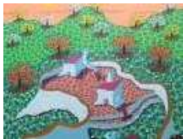
Miguel Guerra Zamora

Que estas imágenes coloridas y amables nos os engañen en cuanto a su significado. Las imágenes significantes han ido surgiendo de forma continuada y con fluidez. [ver+]