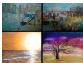
Una pincelada, dos pinceladas...la explosión del color

La muestra reúne las obras de cuatro artistas de Argentina, Francia y España, que dialogan con sus propias miradas. [ver+]